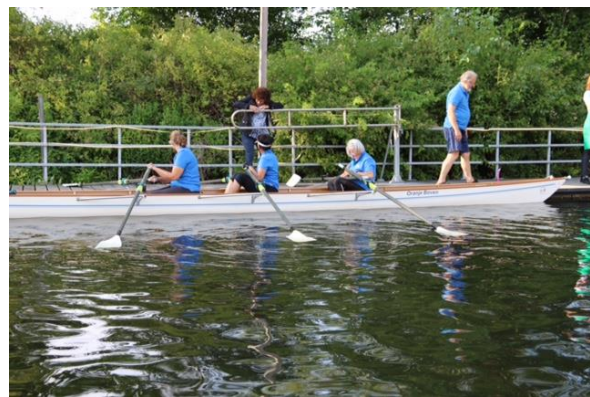
Avondtocht naar Oud Verlaat, op 14 juni.

Onderstaand het verslag van de twee lange tochten die we maakten naar Oud Verlaat op 14 juni en 22 oktober 2019. Op foto 1 liggen we klaar voor vertrek voor de 24 uurs van de Rotte .